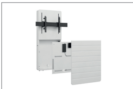
Einfache Montage durch herausnehmbare AV-Montageplatte