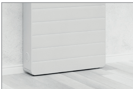
Stellfüße unter dem Korpus sorgen bei Bedarf für einen Niveaueingleich