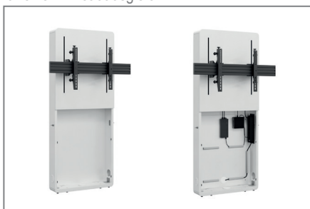
AV-Zubehör findet im Inneren problemlos Platz